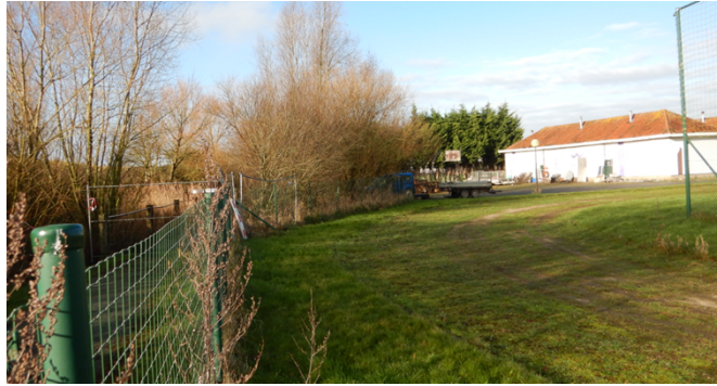
Foto: zone verlegging fiets- en wandelpad

Met de aankoop van deze 6a 82ca kunnen we het wandel- en fietspad verleggen naast de poel.