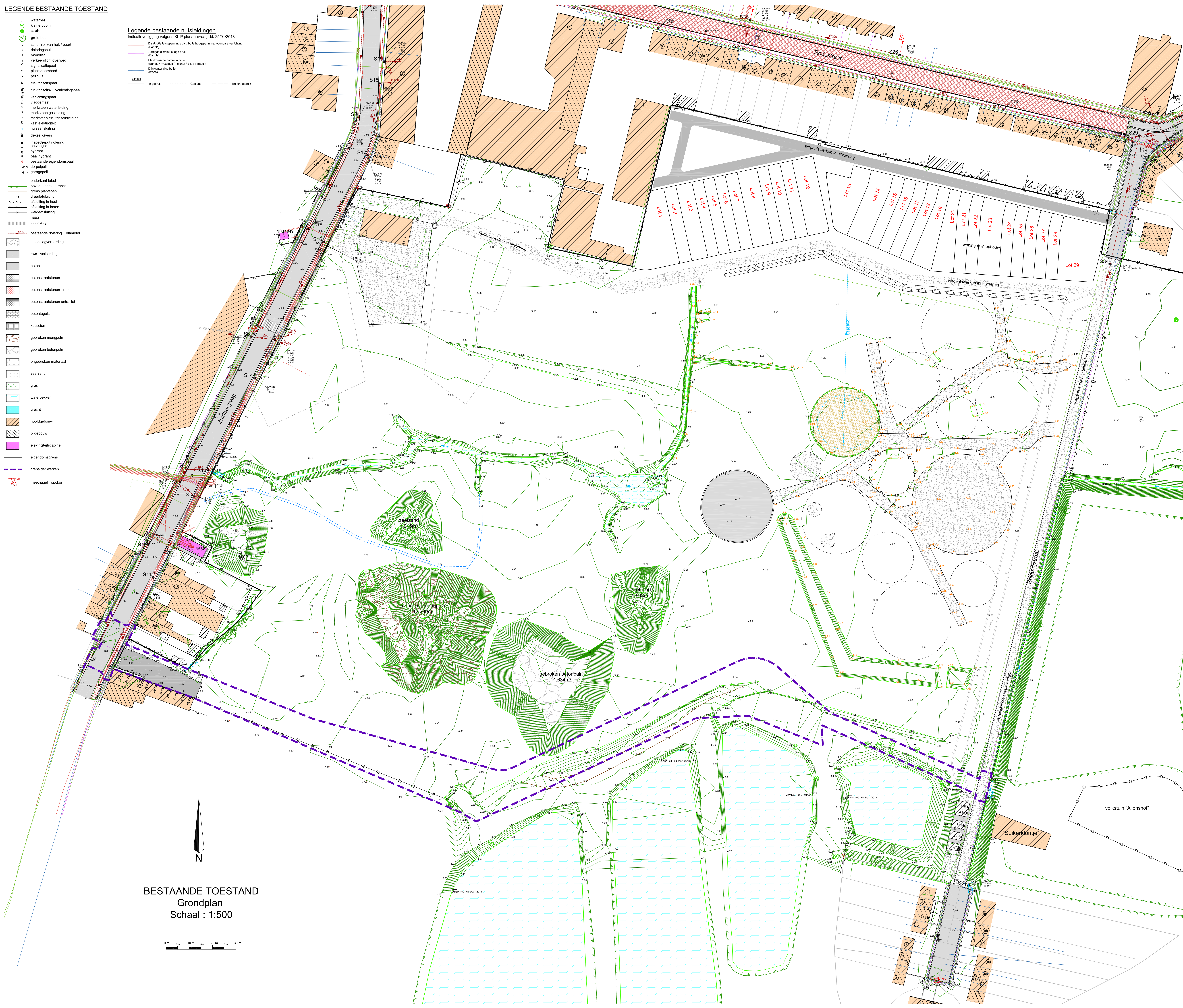
BESTAANDE TOESTAND Grondplan Schaal : 1:500

Legende bestaande nutsleidingen Indicatieve ligging volgens KLIP plannenaamrags d.d. 25/01/2018 (Gis) (Gis) (Gis) Elektrische communicatie (Gis) (Gis) (Gis) (Gis) (Gis) (Gis) Overstroom distributie (WVA) Lijnsoort: In gebruik, Gepland, Buiten gebruik